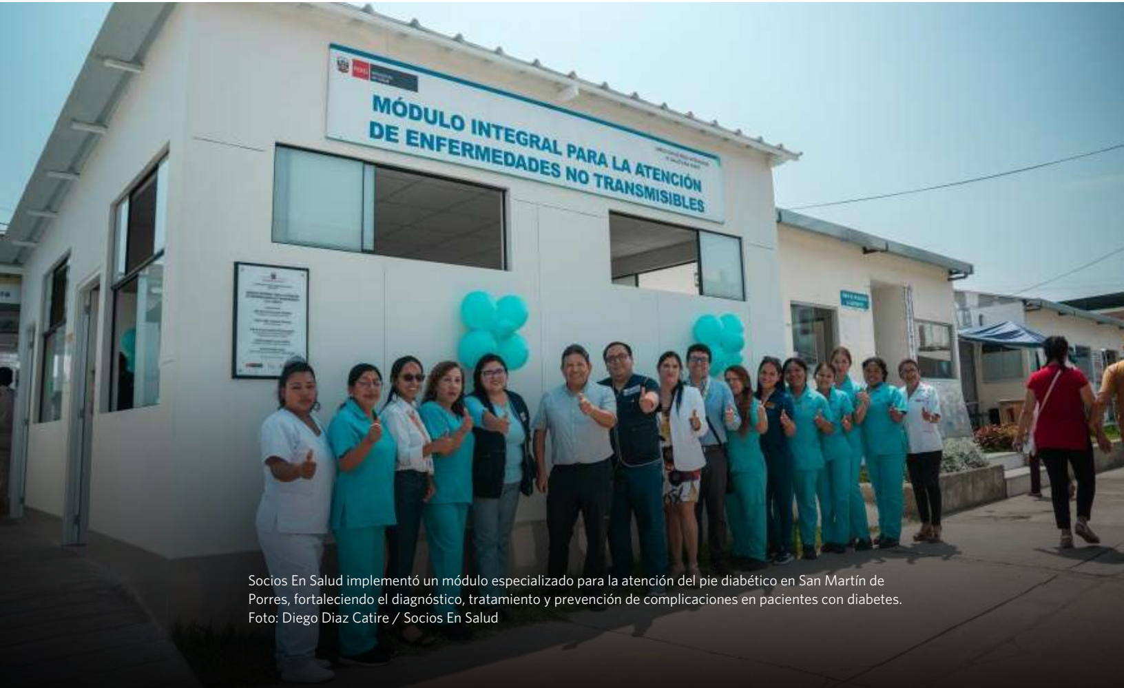
Socios En Salud implementó un módulo especializado para la atención del pie diabético en San Martín de Porres, fortaleciendo el diagnóstico, tratamiento y prevención de complicaciones en pacientes con diabetes.

Nos permite, también, una evaluación constante de estrategias y proyectos, y mantener informada a nuestras audiencias sobre cómo se ejecuta el compromiso comunitario que nos guía.