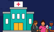
ATENCIÓN MÉDICA GENERAL EXÁMENES AUXILIARES