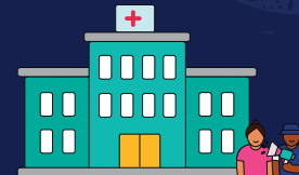
ATENCIÓN MÉDICA ESPECIALIZADA