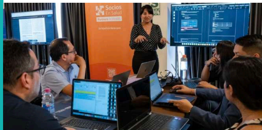
Socios En Salud, junto la Universidad de Alabama (EE.UU.), la Sociedad Peruana de Neumología y el Ministerio de Salud, impulsó el taller nacional para fortalecer el manejo clínico de la enfermedad pulmonar post-tuberculosa y actualizar protocolos de atención en el país.

Entre 2024 y 2025 se desarrollaron tres experiencias de este tipo. Del 11 al 16 de agosto de 2024 se realizó el Brigham and Women's Global Health Residency Bootcamp, de perfil científico y con participación externa. El programa reunió a asistentes de Estados Unidos, Canadá e India, y se desarrolló en sesiones bilingües, en inglés y español.