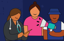
EQUIPO SES Y PERSONA VULNERABLE*

ACERCAMOS A LAS PERSONAS VULNERABLES* A LOS ESTABLECIMIENTOS DE SALUD.